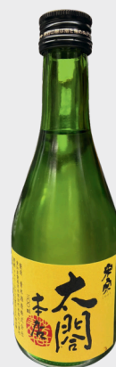
ビール（小瓶） 500円 ノンアルコールビール 600円 太閤冷酒（300ml瓶） 1300円