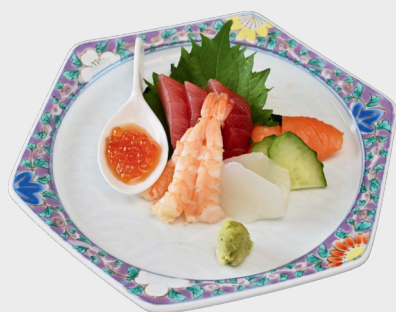
お刺身盛り合わせ 1200円