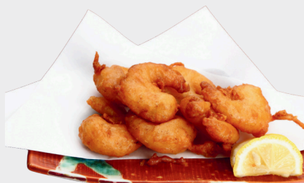
プリプリ海老唐揚げ 700円