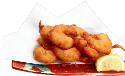
プリプリ海老唐揚げ 700円