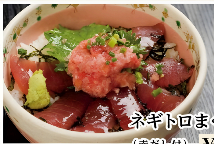
ネギトロまぐろ丼 (赤だし付) ¥1200