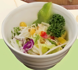
ミニサラダ セット +180円