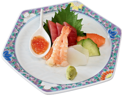
お刺身盛り合わせ 1000円