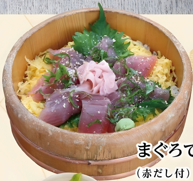
まぐろてこね寿司 (赤だし付) ¥1300